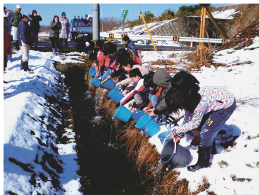
サケ稚魚放流(五泉市赤羽地区)